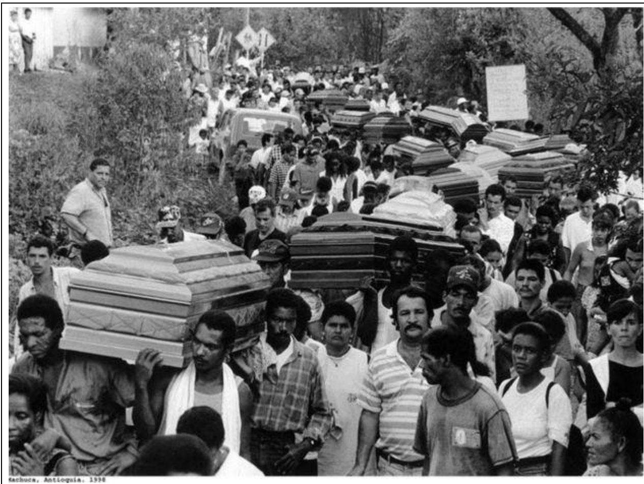
Sachucá, Antioquia, 1998